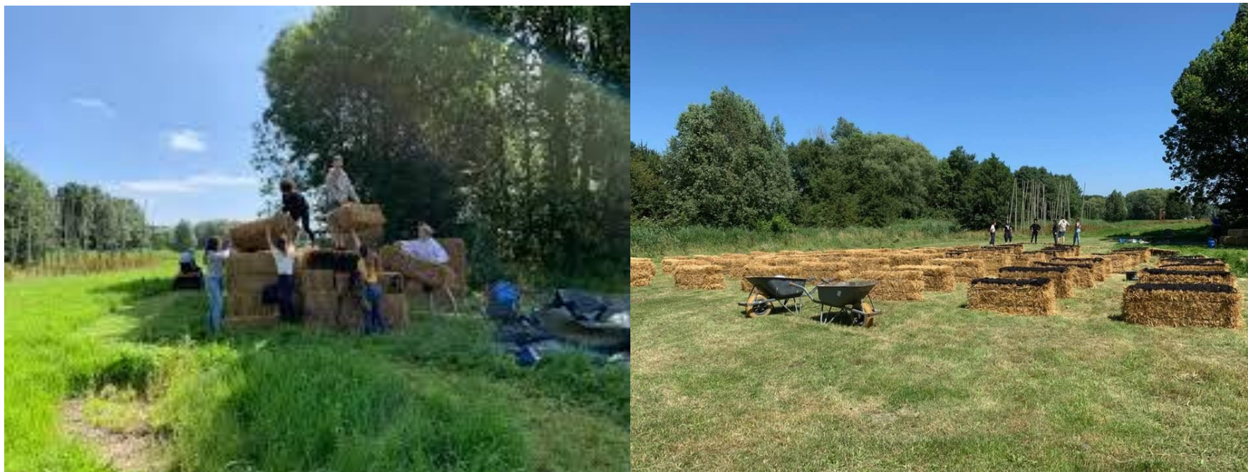
PROJECT HERMES & HESTIA MSC2 LEARNING TROUGH MAKING TU DELFT FACULTY OF ARCHITECTURE.

Studenten van de faculteit bouwkunde hebben de gelegenheid gekregen van Land Art Delft, om hun project Hermes & Hestia op haar terrein uit te voeren. Er is in de volle zon gebouwd en goed samengewerkt. Het resultaat mocht er zijn en werd geopend met feestelijk presentatie in de galerie. Het werk is de hele zomer voor het publiek toegankelijk geweest en deze kwamen de installatie in grote getalen bezoeken.