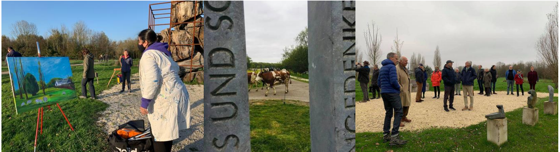
Bezoekers van de tuinen