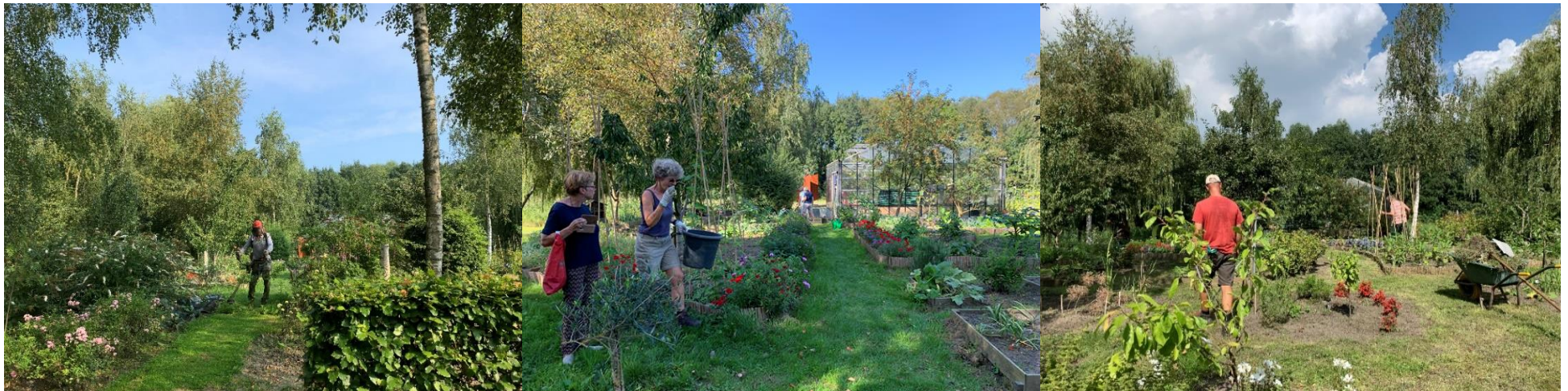
Tuinvrouwen en mannen aan het werk in de moestuin